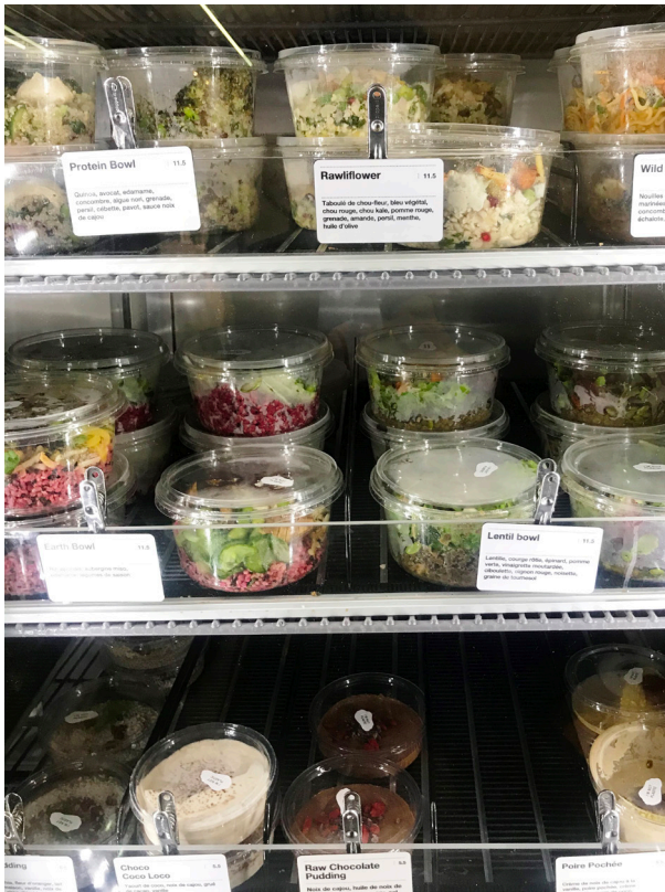
Lafayette Anticipations, Paris