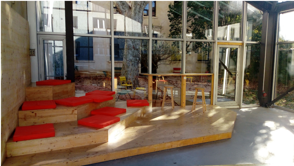
Photos du jardin des filles