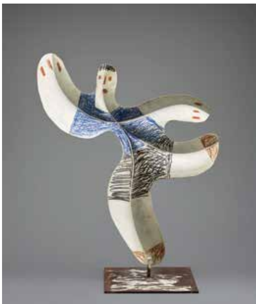
Pablo PICASSO Footballeur Cannes, printemps 1961