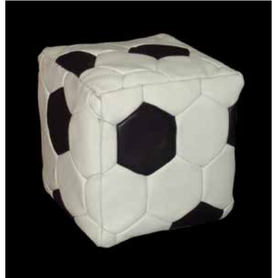
Fabrice HYBER POF 65 – Ballon carré 1998