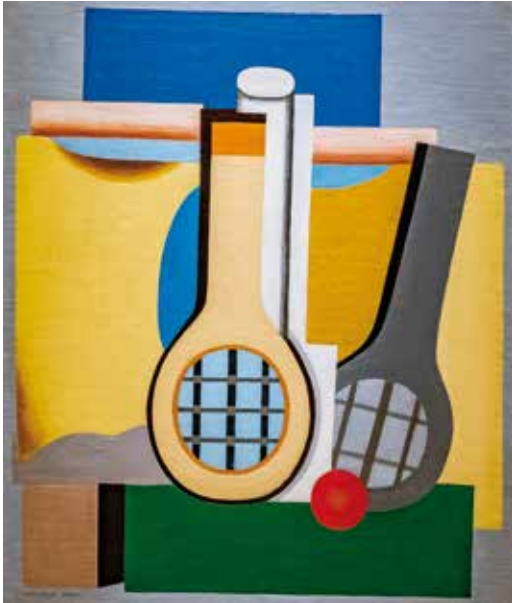
Marcelle CAHN Les Trois Raquettes 1926