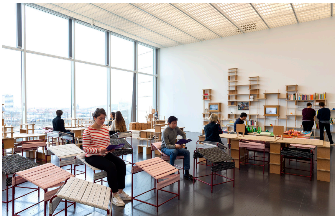
smarin, Écoletopie , 2021.

Le studio de design smarin conçoit depuis près de vingt ans des projets de mobilier, de scénographie et d'aménagement d'espace. À partir d'objets-outils et de mobiliers-systèmes, il construit des espaces à composer ensemble et propose des situations d'interaction inclusives, créant une expérience commune et invitant à reconsidérer la gestuelle. Pour l'exposition L'Art d'apprendre. Une école des créateurs , smarin a conçu une salle de classe qui permet l' otium : il s'agit du temps durant lequel une personne profite du repos pour s'adonner à la méditation, aux loisirs studieux. Cette salle de classe s'appelle Écoletopie .