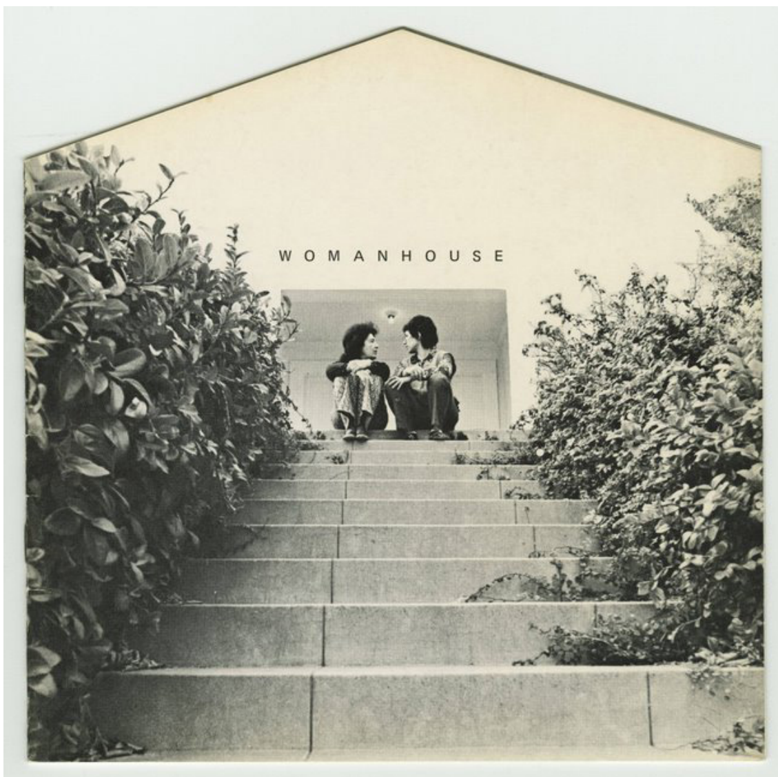
Judy Chicago et Myriam Shapiro devant la Womanhouse.

qui devient le théâtre de leurs performances, installations et ateliers de conscientisation. Les pièces sont métamorphosées en environnements déroutant les fantasmes et clichés du foyer. La construction de la féminité et la domesticité y sont exorcisées. La Womanhouse devient un espace de déconstruction et d'émancipation inédit.