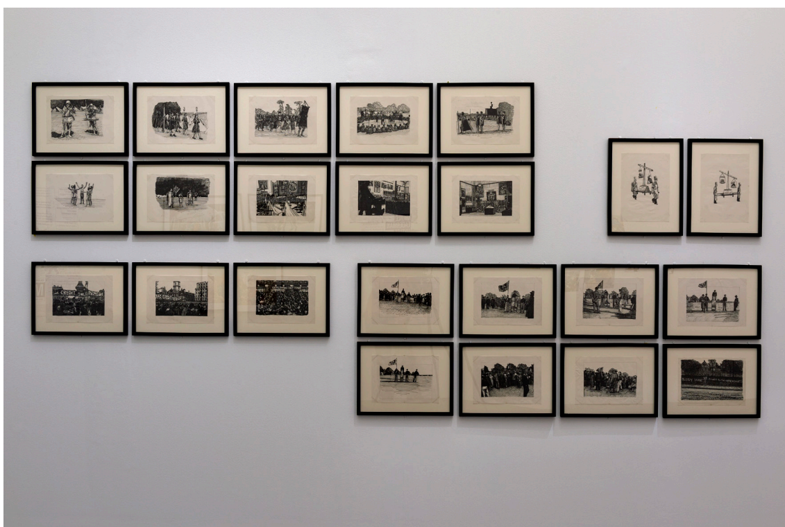
Olivia Plender, Bring Back Robin Hood , 2008 (détail).

La figure de Robin des Bois convoquée dans un contexte de crise économique, comme celle des enfants du Kibbo Kift, cristallise l'idéal d'une paysannerie libre et d'une nation insoumise aux affres du capitalisme.